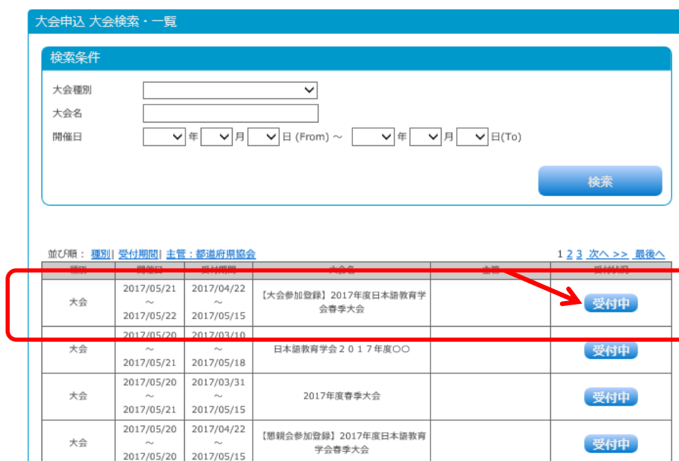
図2：大会申込 大会検索・一覧画面

(2) 「大会申込 大会検索・一覧画面」に移動したら、ご参加希望の催しを選択し、右端の「受付中」ボタンをクリックします（図2）。