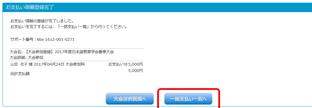
図5：お支払い明細登録完了画面

※以降、お支払いの方法は、年会費のお支払いと同様です（操作マニュアル「会費納入編」5ページ以降を参照してください）。